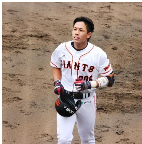
元読売ジャイアンツ 川口寛人氏 内野手