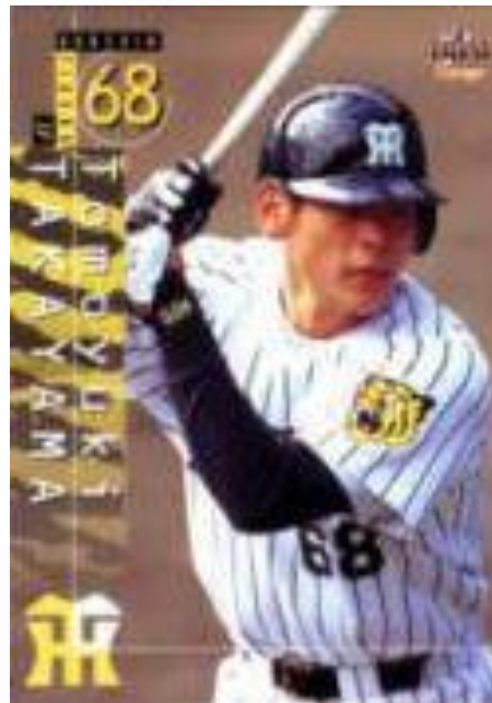
元阪神タイガース 高山智行氏 外野手